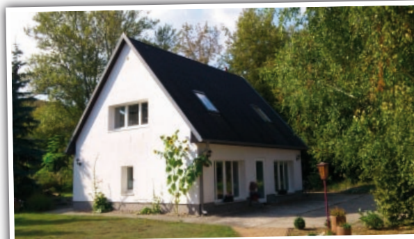
unsere geschäftsstelle in woltersdorf

Gemeinschaftstreffen, Gottesdienste, Kinderkreise, Jugendgruppen, Sportveranstaltungen, Freizeiten, Camps, Seminare, Workshops, Seniorentreffen, Bibelgesprächskreise, Chöre, Bands, regionale Treffen und Veranstaltungen, soziale und diakonische Angebote